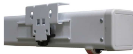
Fixações Easy Fix