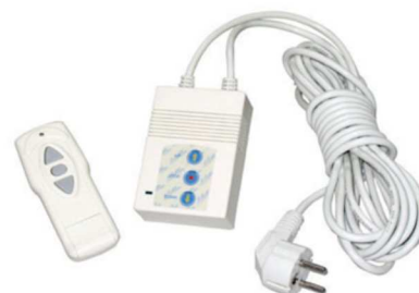
Comando a distância RF